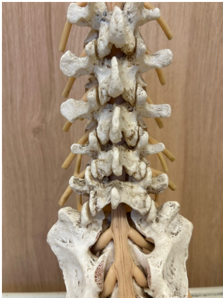
背骨を後ろから見た写真